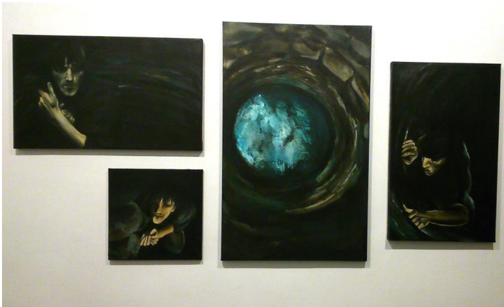
Horgas Karina, De a lélek szabad, 2014.

A kiállításon minden műnek vannak hibái. Eltörpülnek azonban a szándék tisztasága és a gondjaikra bízott emberi problémák képviselőjének biztonsága mellett.