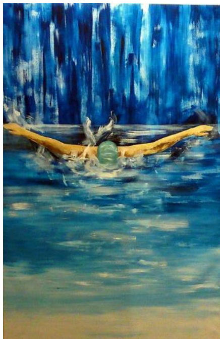
Khoór Viola, Merül, de nem süllyed, 2014.