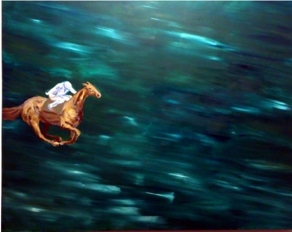
Khoór Viola, Cím nélkül, 2014