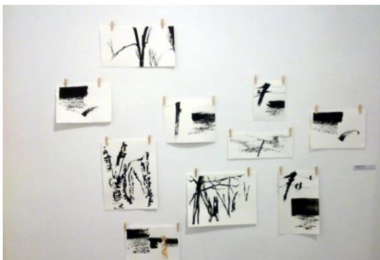
Andrész Anett, Vázlatok, 2014.